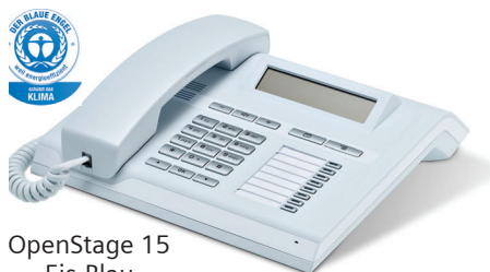
OpenStage 15 Eis-Blau