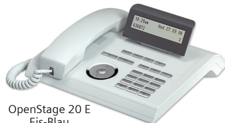
OpenStage 20 E Eis-Blau