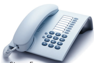
OpenStage 5 Eis-Blau