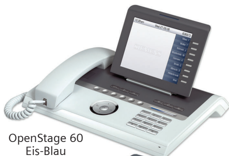
OpenStage 60 Eis-Blau