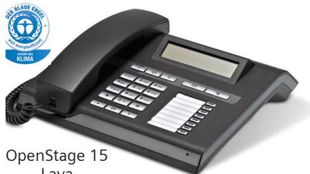
OpenStage 15 Lava