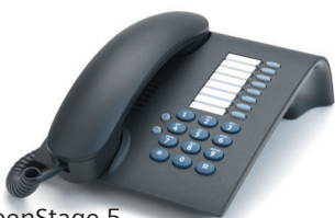
OpenStage 5 Lava