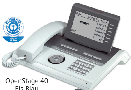
OpenStage 40 Eis-Blau