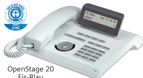
OpenStage 20 Eis-Blau