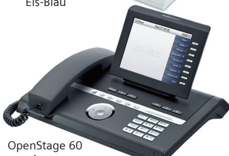
OpenStage 60 Lava