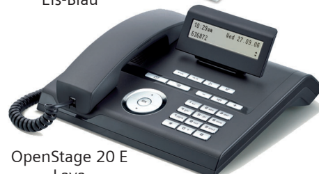
OpenStage 20 E Lava