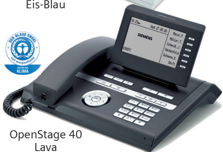
OpenStage 40 Lava