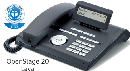
OpenStage 20 Lava