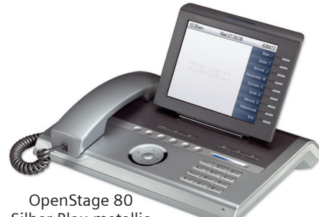
OpenStage 80 Silber-Blau metallic